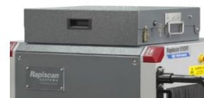
Panel w położeniu zamkniętym

Otwór tunelu (szerokość x wysokość) 540 x 360 mm (21,3 x 14,2 in)